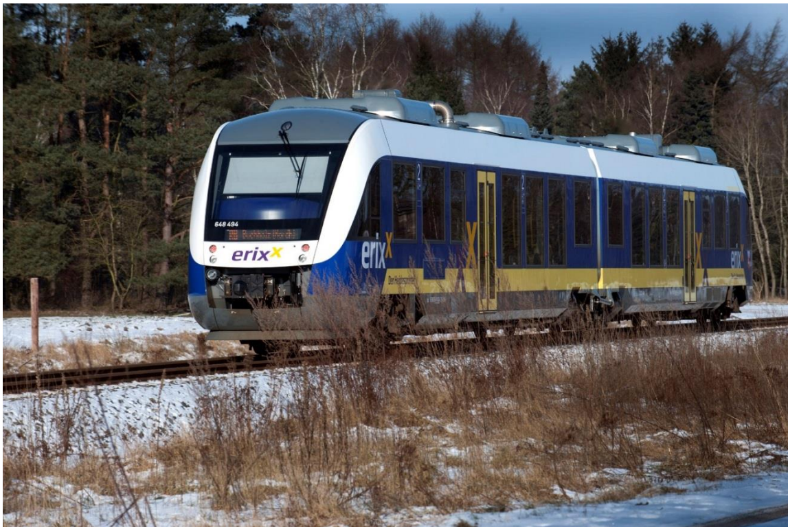
CORADIA LINT 41

42/43 geflügelt und fahren dann getrennt weiter nach Bad Harzburg (RB 42) und Goslar (RB 43). Umgekehrt fahren die Züge getrennt von Bad Harzburg und Goslar nach Vienenburg. Dort werden sie wieder vereinigt und fahren anschließend gemeinsam als ein Zugverband nach Braunschweig. Die Züge der RB 32 Lüneburg – Dannenberg fahren im Dreistundentakt und halten an insgesamt zehn Bahnhöfen. Diese Verbindung zwischen Ilmenau und Elbe verläuft quer durchs Wendland.