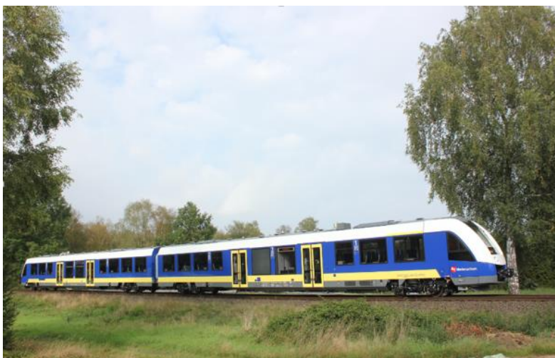
CORADIA LINT 54