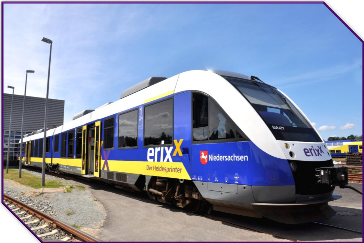
CORADIA LINT 41