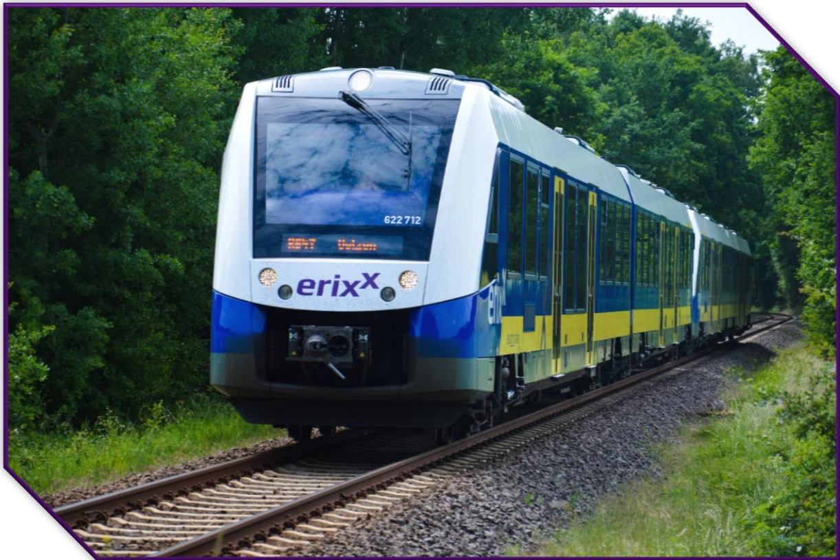
CORADIA LINT 54

Auf den Strecken, die der erix seit Dezember 2014 befährt, werden 28 neue Dieseltriebwagen vom Typ Coradia Lint 54 eingesetzt.